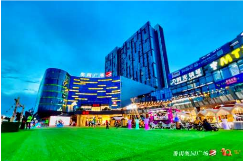
廣州番禺奧園廣場

月開始，沿著成長里程碑的時間軌跡，著力與不同圈層的消費者、合作夥伴情感共頻，每個月推出一個主題。到了 12 月，奧園商管推出「未來」主題活動向公眾宣告攜手邁向新征程的決心。