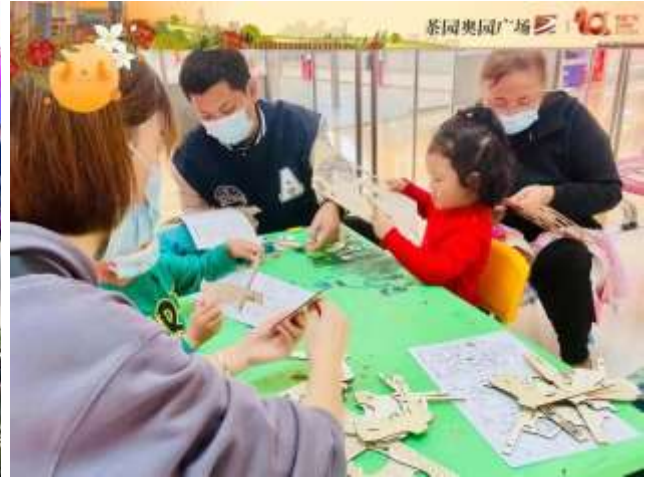
社群連結線下活動

無論消費模式、商業時代如何更迭，奧園健康商管始終堅持從消費者和合作夥伴的真實需求、情感深處出發，創新運營模式，懷揣著「傳遞溫情生活」的願景，打造可持續的差異化道路，為各圈層消費者帶來互動、趣味的消費體驗。