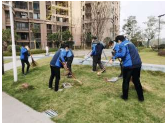
洗地毯與清理草坪