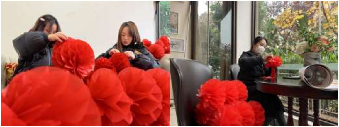
物業人員準備裝飾物料

精心準備，迎接 2023。元旦前夕，奧園健康物業管家便在精心準備燈籠、裝飾貼、彩旗等節日佈置裝飾物料，新年喜慶的氛圍呼之欲出。