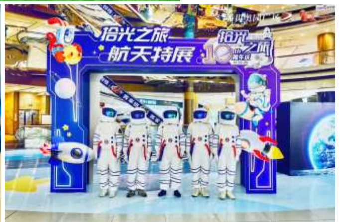
「拾光之旅」航太特展

2012 年 12 月，廣州番禺奧園廣場正式開業，經過 10 年的運營，廣州番禺奧園廣場成為區域內地標性的一站式大型購物中心。十年成長發展，對於廣州番禺奧園廣場來說是一個值得銘記和回顧的里程碑。10 周年之際，廣州番禺奧園廣場為消費者帶來了「超長假期」，從 2022 年 6