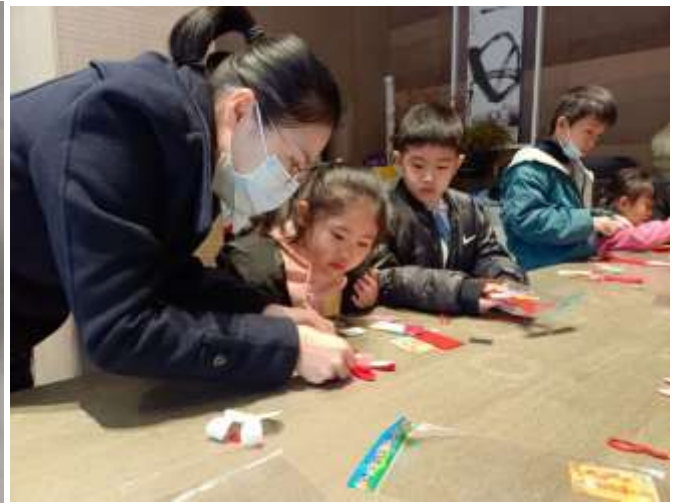
探望長者與舉辦 DIY 活動