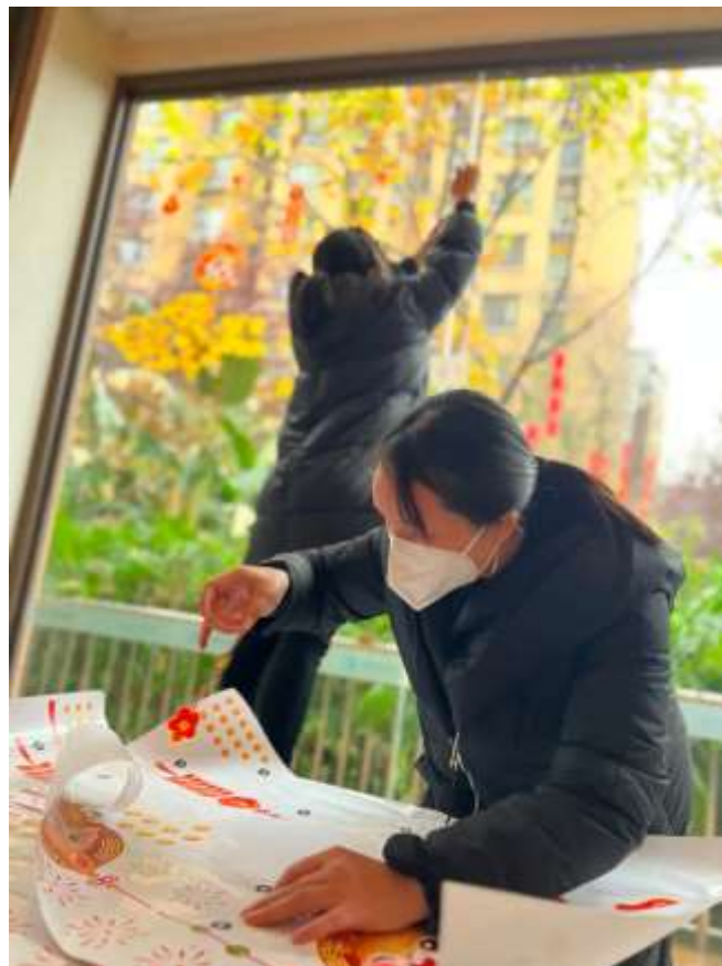
管家在設計新年裝飾貼

2022 年落下帷幕，有辛酸有快樂也有感動。2023 年揚帆起航，願山河無恙、奔赴美好。